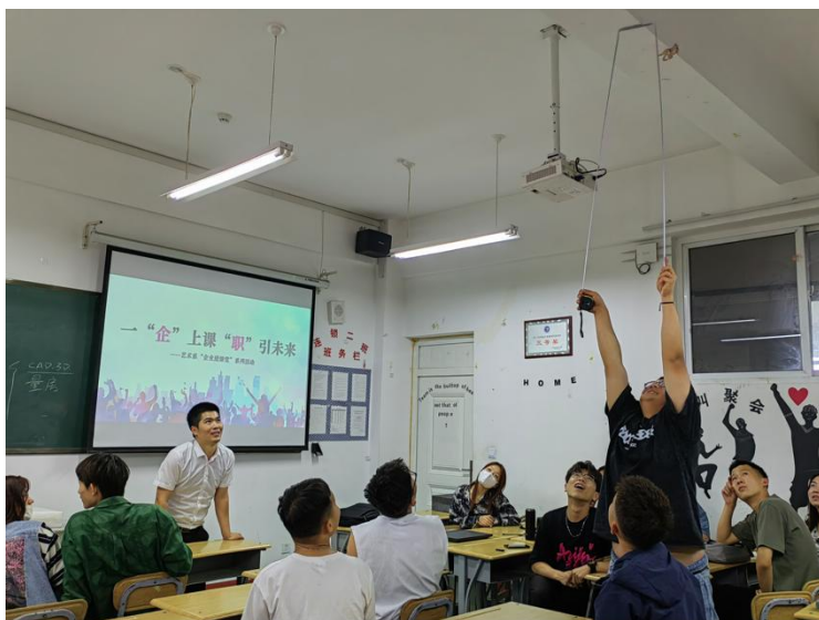
图 3-1 企业导师传授量房技巧