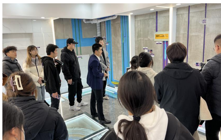
图 3-5 公司材料展示中心参观实践