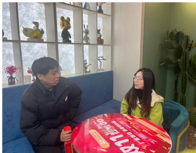
图 3-6 回访留企就业学生

以“就业为导向”构建全链条金就业服务体系，打通“实训—实习—就业”的“最后一公里”。依托校外实践基地，为大三学生提供跟岗实习，基于企业岗位需求，针对性开展岗前岗位技能培训与测试，实现人才培养与企业岗位需求的精准匹配。实习中配备“校内导师+企业导师”双导师团队，全程指导学生适应职场环境、掌握岗位核心技能。实习期满后，对表现优异的学生直接发放录用通知书，实现“实习即就业”。同时，建立毕业生跟踪服务机制，定期回访已入职毕业生，为其提供在职技能提升培训与职业发展指导，助力毕业生快速成长为企业骨干，既保障了学生就业质量，也为企业输送了稳定的高素质人才。