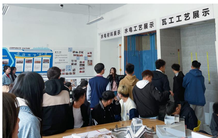
图 3-4 施工工艺项目实训

以校企共建的材料与施工工艺实训室为核心，进一步升级实训硬件与软件配置，打造“场景化、全流程”金实训基地。依托实训室四大工艺展示区及丰富材料资源，开发“沉浸式实训”项目，让学生置身在家装现场的环境中，模拟家装顾问为客户介绍水电改造、瓦工铺贴、木工制作、油工施工等核心工艺；同时，联动校外实践基地，每学期根据课程安排，组织学生进入企业样板间、材料展示中心、施工工地等场景进行参观实训，不断提升岗位实操能力，实现实训过程与企业生产过程的无缝衔接。