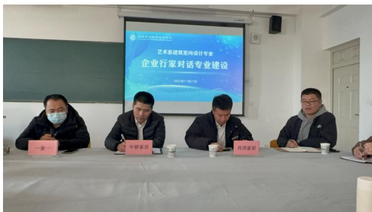
图 3-2 企业行家对话专业建设研讨会