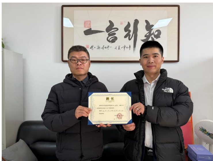
图 3-3 特聘企业导师