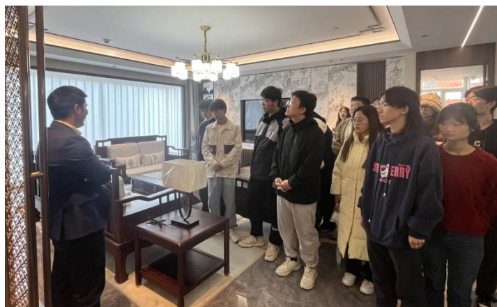
图 2-2 大二学生前往公司进行校外实践