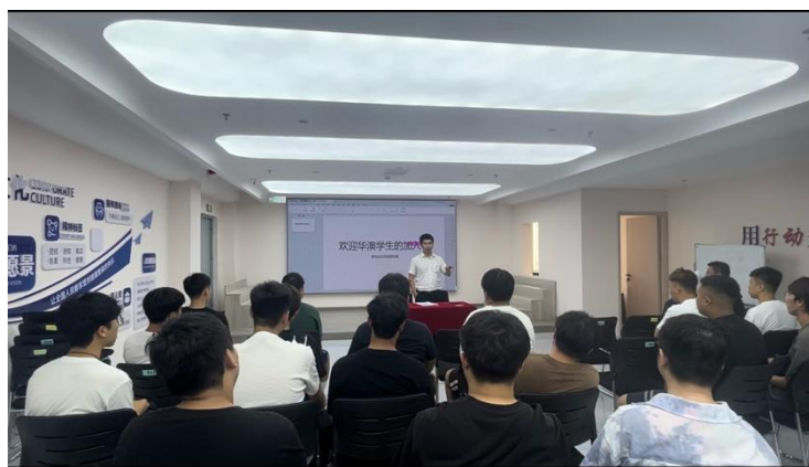
图 2-3 实习学生参加岗前培训